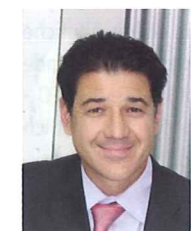
ist Sales Director bei der ARVAL (Schweiz) AG