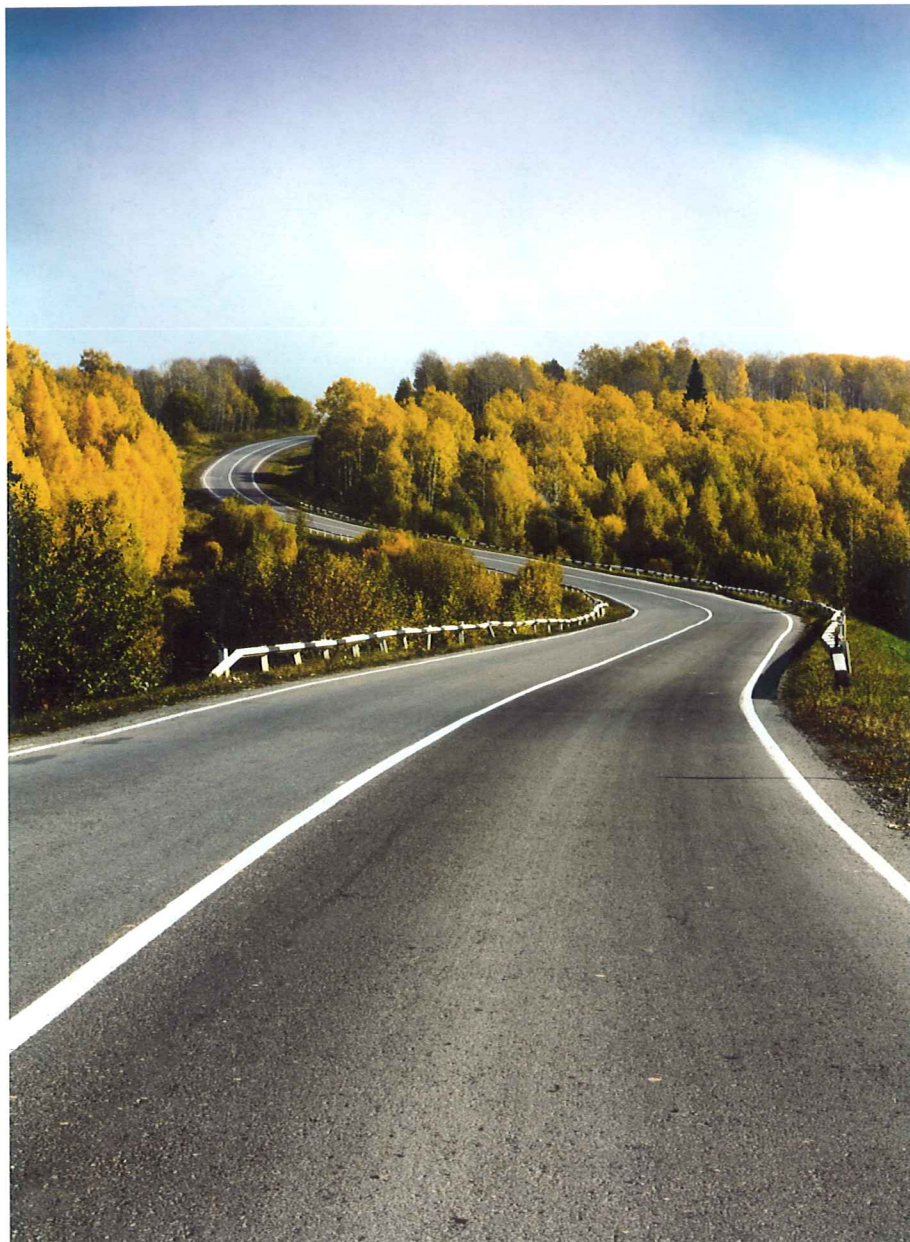
Den Weg für nachhaltige Lösungen frei machen

K raftstoffsparende Fahrzeuge und Hybrid-Modelle liegen im Trend. Umfragen zeigen es deutlich: Die Mehrheit der Schweizer Unternehmen spricht sich für eine verstärkte Nutzung von Kraftstoffsparenden Fahrzeugen aus. Und auch der Trend zu Hybridantrieb nimmt an Fahrt auf.