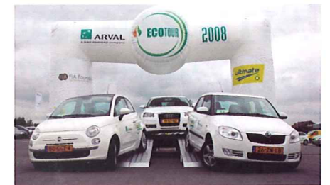
Nicht das schnellste sondern das ökologischste Auto ist bei der «Eco Tour» gefragt

Im ersten Halbjahr 2008 betrug der CO 2 -Ausstoss der insgesamt 16 Fahrzeuge rund 80 Tonnen. Die von ARVAL als Kompensation für verursachte CO 2 -Emissionen einbezahlten Beträge werden von My Climate wunschgemäss in nationale und internationale Klimaschutz-Projekte investiert.